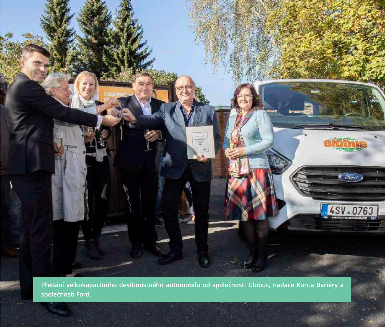
Předání velkokapacitního devítimístného automobilu od společnosti Globus, nadace Konta Bariéry a společnosti Ford.